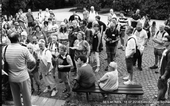
SES en Nitra, 18.07.2014

angla), kiu klarigas kiamaniere oni minadis en la apartaj epokoj. Poste, ĉiu ekipita per kasko, lampo kaj mantelo, ni malsupreniras en subteran galerion. Kelkfoje ĝi estas tiel mallarĝa, ke oni povas apenaŭ paŝi, aŭ tiel malalta, ke la kapo frapiĝas kontraŭ la rokon. La atmosfero estas tre malseka, oni senĉese aŭdas glugli akvon. Kia peniga laboro...