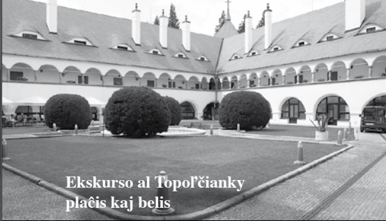
Ekskurso al Ĥopofĉianky plaĉis kaj belis