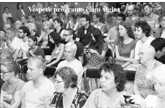
Vespere programo ĉiam viglas