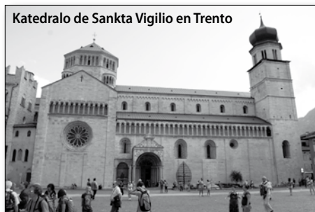
Katedralo de Sankta Vigilio en Trento