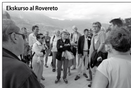
Ekskurso al Rovereto