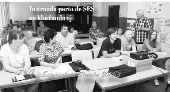
Instruada parto de SES en klasĉambroj

Popoludnia priŭhŭovali bohatŭm programom. Popri rŭznŭch prednŭŝkach na rozliĉnŭe tŭmy, napriklad o bezpeĉnosti na internete, rŭznŭch naronnyĉ a plannŭvyĉ jazykoch, Wikipedii alebo o tŭmach, kotore sŭvisia s esperantskŭm hnutŭm, konali sa aj rŭzne kurzy. Tancachtivŭ sa mohli ŭĉit' tango alebo ĉardaŝ, hudobnikov priŭhŭoval kurz o ukulele alebo spievanie polskŭch piesnŭ. Inŭ sa zabavali pomocou origami, ozdobovanŭm triĉiek, alebo si pocviĉili svoje jazyky polskŭmi jazykolamami. Poĉas celŭho podujatia boli k dispozicii rŭzne ŝportovŭe potreby. Zadarmo sa dal hrat' stolnyĉ tenis, tenis a bedminton.