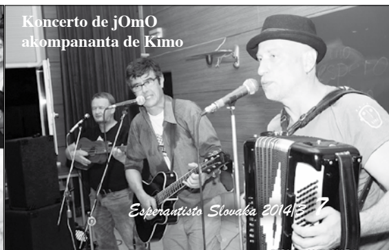
Koncerto de jOmO akompananta de Kimo