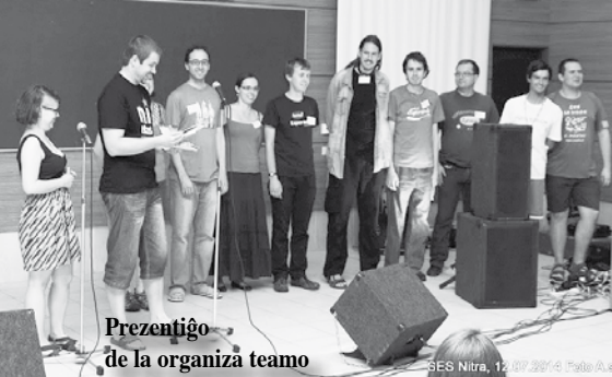
Prezentiĝo de la organiza teamo