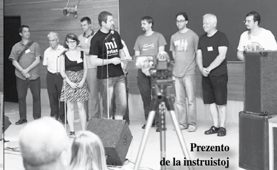
Prezento de la instruistoj