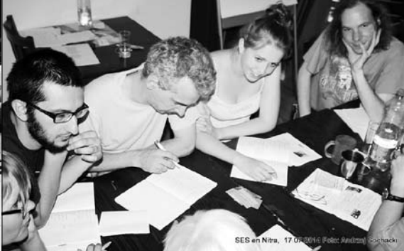
SES en Nitra, 17.07.2014

Dum la posttagmezo mi provas eklerni la slovakan. Oni diras, ke tiu lingvo estas la Esperanto inter slavaj lingvoj. Kiam mi vidas, ke ekzistas pli ol dek deklinaciojn por substantivoj (laŭ la genro kaj la fina litero de la vorto) en tiu „simpla“ lingvo, kiaj estas la aliaj !