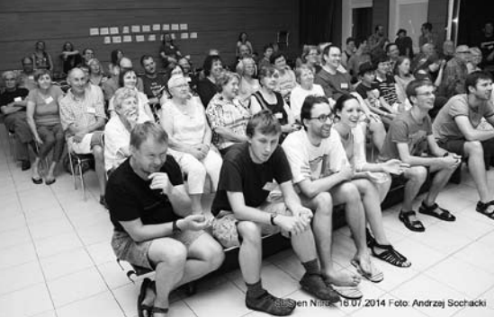
SES en Nitra, 16.07.2014