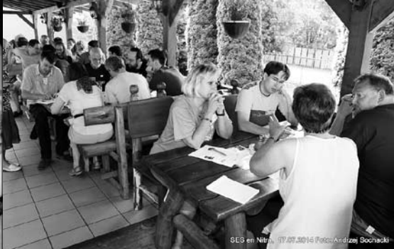
SES en Nitra, 17.07.2016